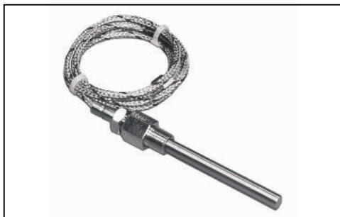
z króćcem stałym